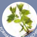
FORMAZIONE DEL RACHIDE